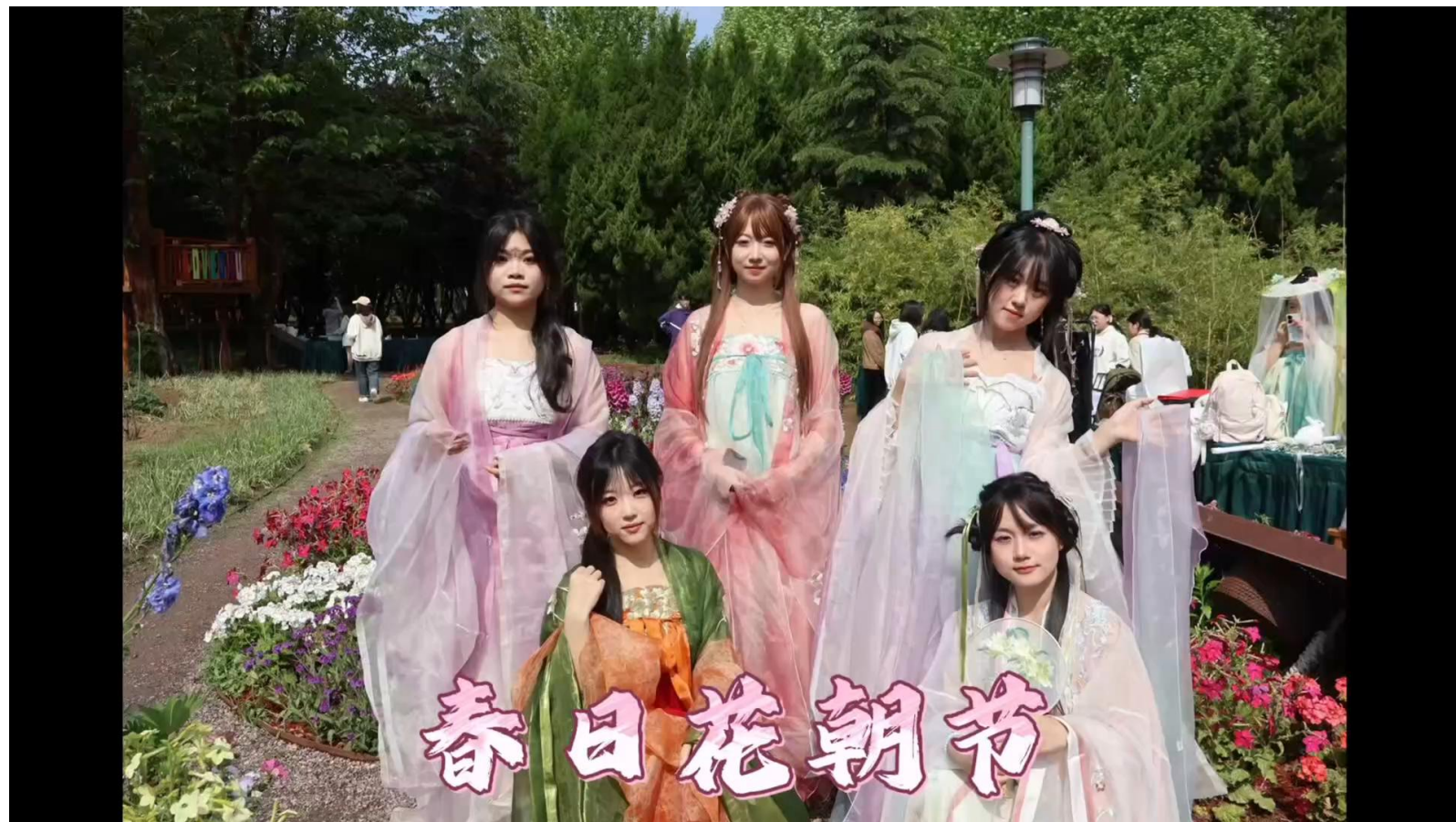
园林科技文化节暨春日花朝节