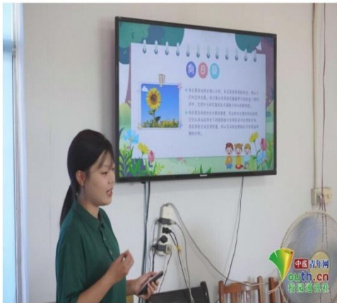
图为队员教授植物认识课程。

7月28日，青岛农业大学园林与林学院“四境寻青，共美乡居”赴山东省滨州市邹平实践服务团赴山东省滨州市西董街道办事处樊大庄村（村委会）展开暑假社会实践支教服务活动。支教团队深入乡村学校，为孩子们带来别开生面的暑期课堂。团队成员精心开设植物认知、音乐、舞蹈等多元课程，课堂气氛热烈有序，主讲老师认真投入，陪同老师耐心沟通，悉心解决孩子们的问题。特别值得一提的是，“两弹一星”主题宣讲让孩子们了解历史，增强了爱国情怀。（通讯员 王冰雁）