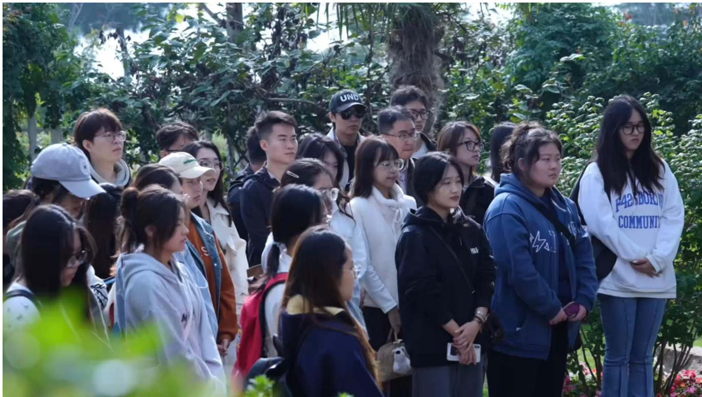
赴美田花园研学实习

学院打破传统教育组织壁垒，突破专业教研室、教学团队的局限，构建“开放协同”的劳动教育组织运行机制，形成 校内校外联动、课内课外贯通、专业思政融合 的育人合力。